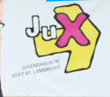
JUGENHAUS IM STIFT ST. LAMBRECHT