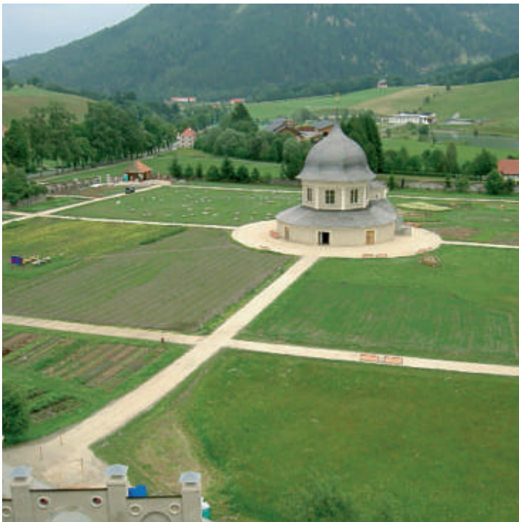
Der frisch erblühte Stiftsgarten mit dem Pavillon

Im Juli 2005 feierte domenicco seinen 1. Geburtstag. Nun ein kurzer Rückblick: Während der letzten Monate ist es im Rahmen des sozialen Arbeitsprojektes gelungen, sowohl sinnvoll Arbeitsplätze für Menschen mit besonderen Bedürfnissen zu schaffen, als auch ein Kulturdenkmal für die Öffentlichkeit zu bewahren. Der vierteilig gestaltete Stiftsgarten bezaubert(e) mit den Elementen Feuer, Erde, Luft und Wasser und den darin gepflanzten Kräutern (von Tee-, Gewürz- und Küchenkräutern bis hin zu Kräutern von Hildegard-von-Bingen) und Gemüsesorten nicht nur die BesucherInnen, sondern auch die Jury des österreichweiten Gartenwettbewerbs der Tageszeitung „Kurier“. Dieser „bescherte“ domenicco den 1. Preis in der Kategorie „Öffentliche Gärten“! Derzeit ist die Ernte voll im Gange: Es werden Rohstoffe für Kräuterpesto, Säfte u.v.m. gesammelt und die ersten Teemischungen, bei der man sich alter benediktinischer Tradition bedient, zusammengestellt.